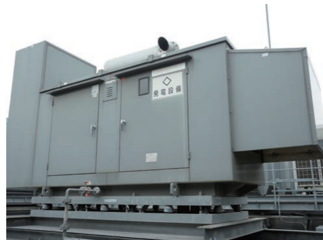
屋上の自家発電設備。停電時、自動稼働する

ビル備え付けの非常用電源の他に、自社で自家発電設備を増設しており、災害時の帰宅困難者向け施設およびBCPに対応できるようにしている。自家発電稼働は約80時間で、3階と7階の空調、照明、一部コンセントの電力として使用できる。