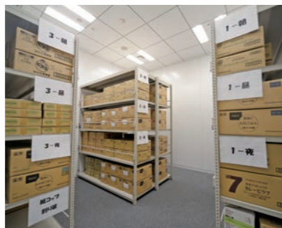
非常食を備えた倉庫。日別に朝、昼、夜の張り紙をし、万が一担当者がいない場合にも食事を提供できるようにしている

東京本社では大地震発災時、帰宅困難となる期間を1週間と想定して、社員400人分(東京本社ビル平均在席者数分)の水や食料、非常用トイレ、寝具、日用品など1週間分を備蓄している。3階と7階の倉庫に分散して保管し、自社のデータベースで消費期限などを管理。さらに社員とその家族を守ることを最優先とする考えから、家族分の水や食料1週間分を社員自宅にも配付している。