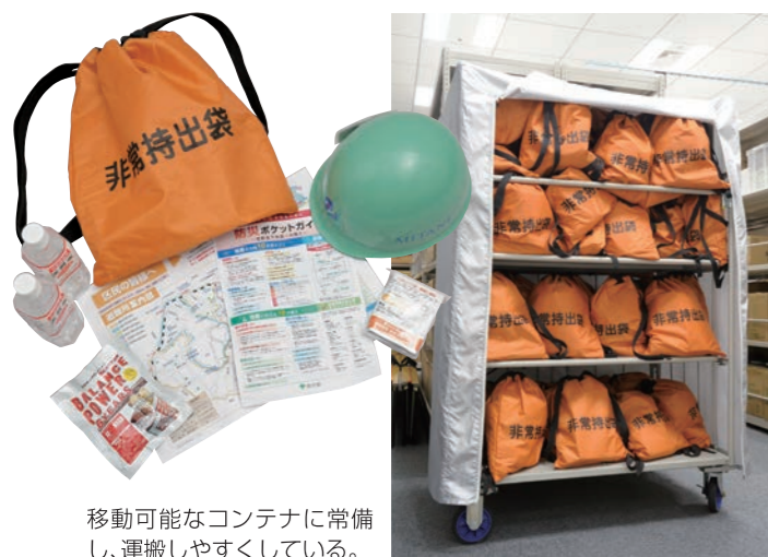
移動可能なコンテナに常備し、運搬しやすくしている。