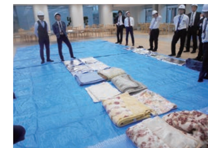
帰宅困難者向け施設開設訓練