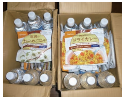
社員自宅に配付している一週間分の水・食料。家族の人数分用意し、自宅が被災した場合への備えとしている