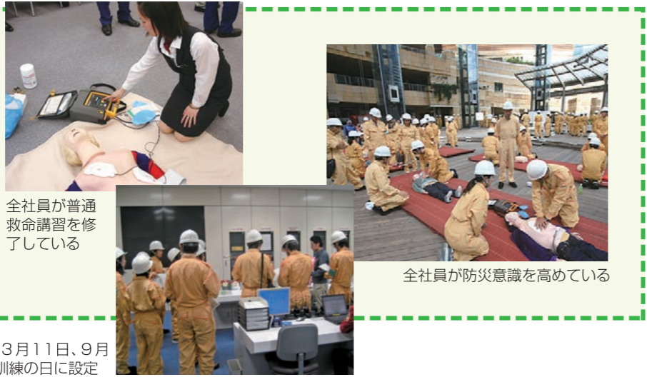
全社員が普通救命講習を修了している

年に2回、全社員を対象にした大規模な防災訓練を実施する同社。街全体の防災を担うため、自治体やテナントとも共同で訓練を行う。また、継続的に救命講習や安否確認訓練を行い、防災対応できる人員育成にも積極的に取り組む。