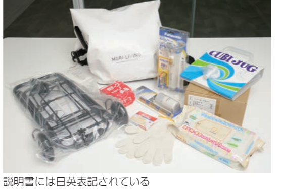
説明書には日英表記されている

住宅居住者用に配布されるエマージェンシーキットには、LEDランタンや水タンクなど、災害時に役立つ11のアイテムが大容量の専用リュックに収納されている(3,000個用意)。