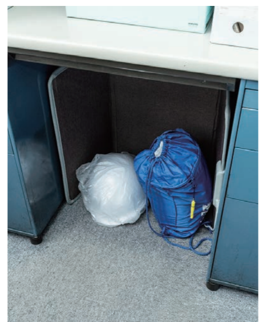
いざという時に取り出しやすいようデスク下に設置