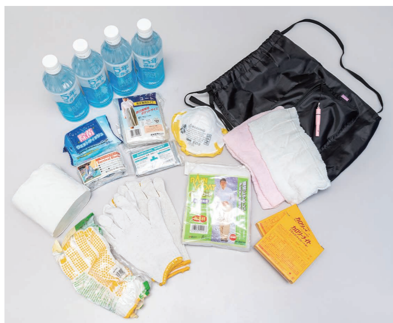
個人用備蓄品バッグの内容例

当初から備蓄品を用意していたが、東日本大震災をきっかけに既存の備蓄品では足りないことを痛感した。この経験を踏まえ、社員の中で検討を重ねた結果、災害時には各個人に必要なものが異なることが分かった。そこで、個人のニーズに応じた備蓄品バッグを用意し、それぞれのデスクの下に設置している。