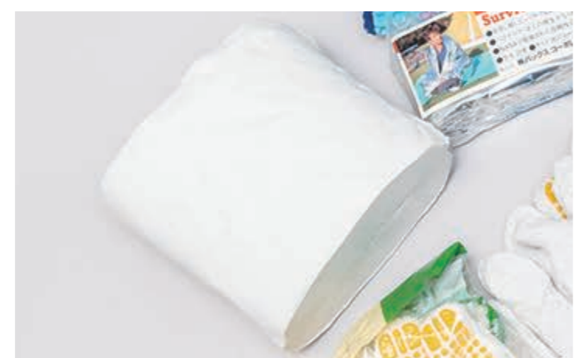
芯を抜いてつづしコンパクトになったトイレトーパー

キャンプが趣味の社員がおり、そのノウハウを防災対策にも活かしている。例えば、トイレトーパーは芯を抜いてつづし、ビニール袋に入れることでコンパクトにできる。トイレトーパーは災害時の避難生活において、絶対に欠かせない重要アイテムなのでコンパクトにして、いろいろな場所に用意している。