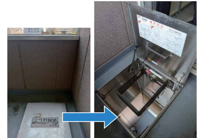
実際に使用すると揺れてスムーズ降りることができない避難はしごでの昇降は普段から慣れることが重要

ビル管理会社が行っている自衛消防訓練に参加しており、災害時の基本的な対応は定期的に学習している。また、より実効性の高い訓練にするために、非常階段だけではなく避難はしごの使用や、消火器での消火訓練を実施するなどの工夫をしている。