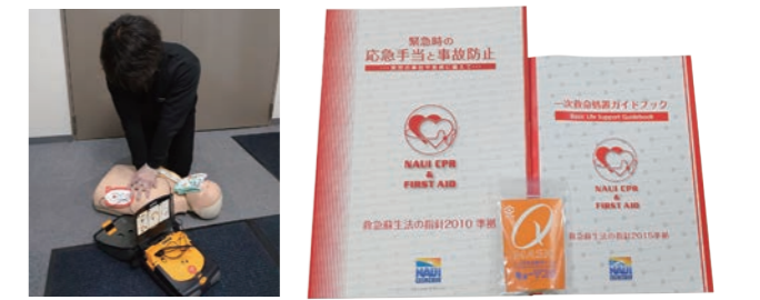
実習をまじえながら楽しくマスター

当社はスクーバダイビング指導団体(教育機関)の本部であり、ダイバーの方などにCPR(心肺蘇生法)、怪我をした際の止血法や、包帯の巻き方、急病の見分け方などの様々なファーストエイドやAEDの使い方の教材を提供している。もちろん社員もファーストエイドの知識を習得しており、災害時の救助・救命活動に役立てる。