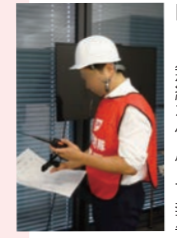
自衛消防隊長からCMTへMCA無線を使用して報告