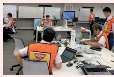
CMTの活動(2018年9月北海道胆振東部地震)

災害対策本部の下部組織CMTが、社内の被害状況や社外のライフライン状況等、様々な情報収集にあたる。