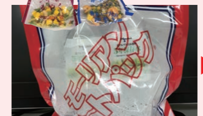
発熱材が入っている袋に水を入れるだけでペットボトルの水を加熱することができる備蓄品