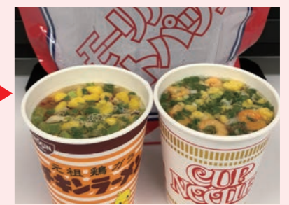
3分後、火を使わずに出来上がり