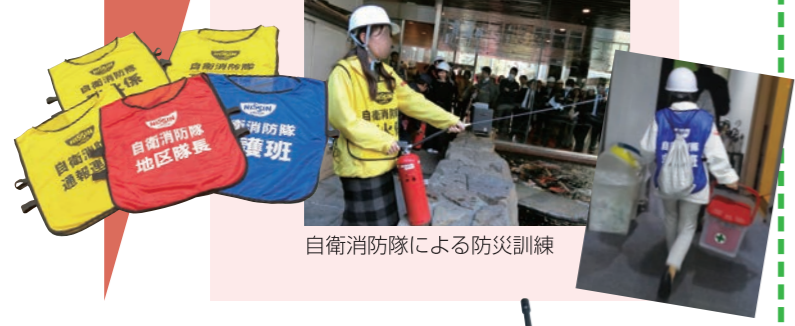
自衛消防隊による防災訓練