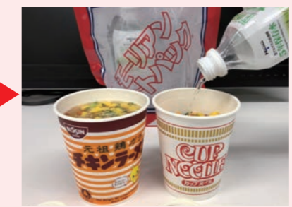
加熱したお湯を即席麺に注ぐ