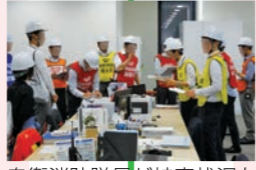
自衛消防隊長が被害状況を集約