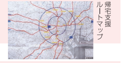
帰宅支援ルートマップ