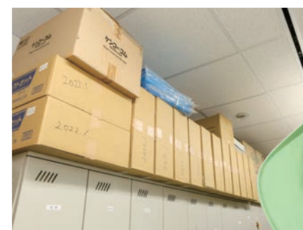
備蓄品の消費期限等をわかりやすく箱に記載

早期より防災用の備蓄品を確保しており、実際に2011年の東日本大震災で役立てた経験がある。2013年の「東京都帰宅困難者対策条例」を受け、防災用備蓄品の準備には力を入れ、社内で備蓄品や防災用品の選定会議を行った。現在、社員3日分の食料や水に加え、毛布、ブルーシート、ガスコンロ、鍋、簡易トイレ、医薬品や工具類を社内に確保している。