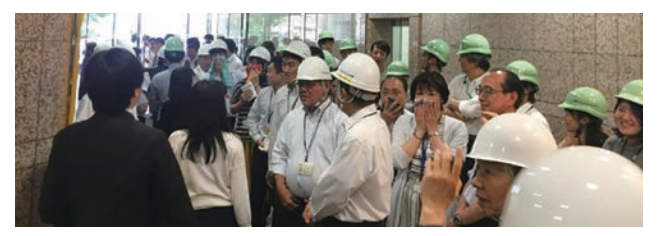
ビル全体での防災訓練の様子

また入居しているビルの規則に従い自衛消防隊を編成。年1回、全社員で消防防災訓練に参加して防災意識を高めている。