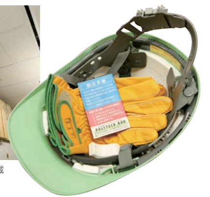
全社員に「ヘルメット・軍手・笛」を配布。各自のデスクの下にマグネットで吊るしてある

備蓄品に加えて、全社員に「ヘルメット・軍手・笛」を配布。各自のデスクの下にマグネットで吊るしてあり、有事にはすぐに取り出せるようになっている。