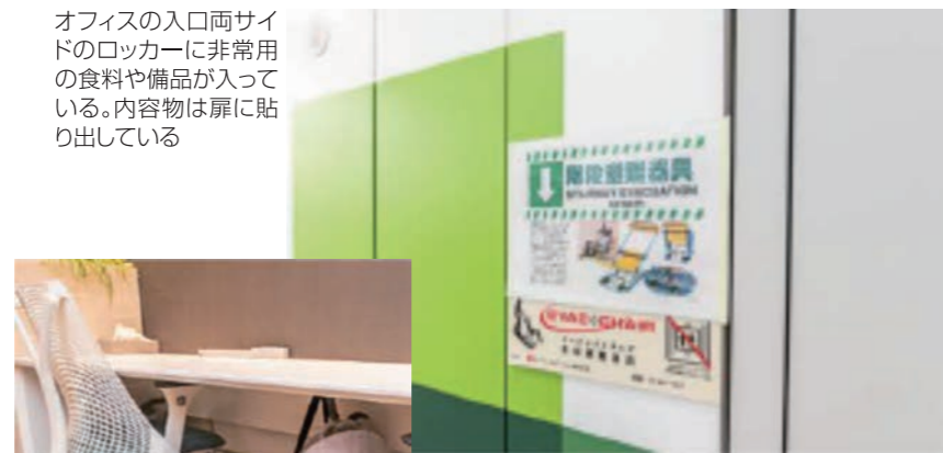
オフィスの入口両サイドのロッカーに非常用の食料や備品が入っている。内容物は扉に貼り出している