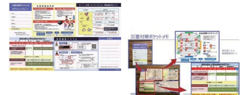
災害対策ポケットメモ 名刺サイズに折りたたんで携帯している

携帯用の「災害対策ポケットメモ」を作成し、非常時に何をすればいいかをわかりやすく指示。災害用トイレやAEDの使い方は動画で使い方がわかるようにしている。