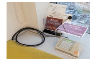
館内放送セットのマイク