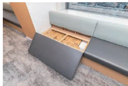
ベンチ下はすべて備蓄用の保管庫としている