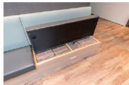
カフェのベンチ下には毛布を保管している