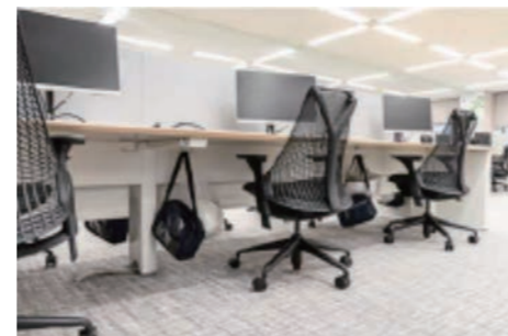
オフィスのデスクの下にもヘルメットとサバイバルバック