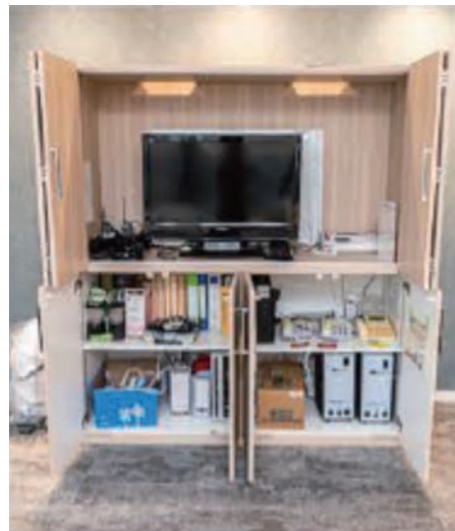
47階のコミュニケーションツール

各フロアに災害時の非常食や備品を装備し、3日間滞在できるようにしている。賞味期限15年の飲料水とすることで5年タイプよりもコストと入れ替えの手間を軽減させた。