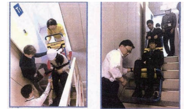
階段避難車イーバックチェア

階段避難車イーバックチェアを装備。エレベータが使用できない災害時に備え、実際に階段を使って訓練している。イーバックチェアまで備えている企業は珍しいと思われる。