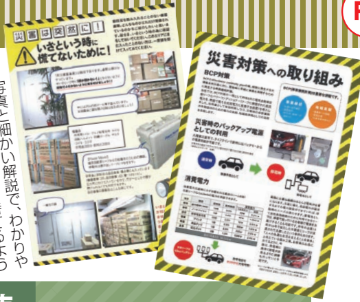
写真と細かい解説で、わかりやすく。防災に興味を持ってもらう工夫された社内報の誌面