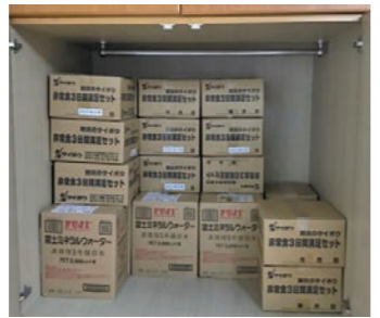
徒歩15分の距離にある寮にも備蓄品を保管