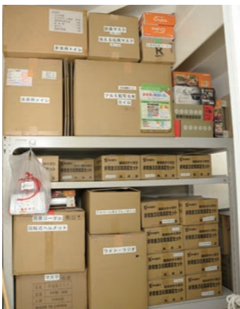
丈夫な階段下や別の倉庫に積まれた備蓄品