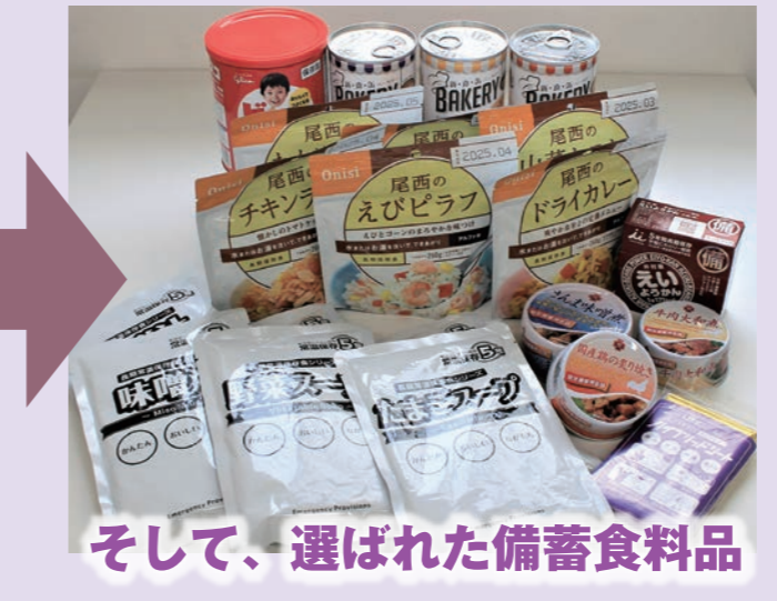
そして、選ばれた備蓄食料品