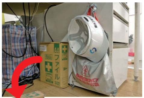
「帰宅難民」にならないよう渡されるセット