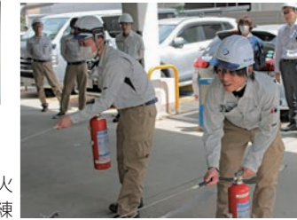
社員の誰もがいつでも消火活動ができるよう、徹底訓練