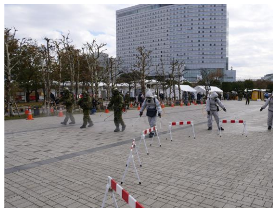
現場除染 (シンボルプロムナード公園)