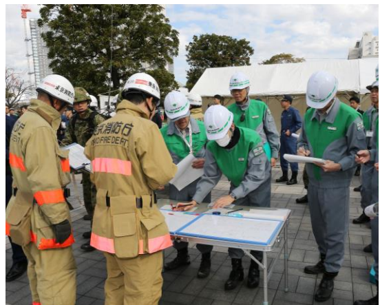
現地連絡調整所 (シンボルプロムナード公園)