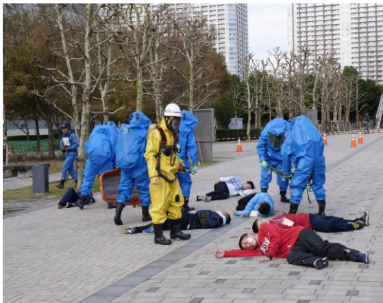
被災者の救出 (シンボルプロムナード公園)