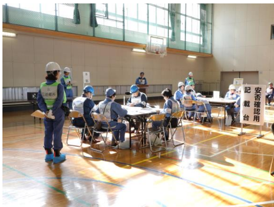
避難所運営 (江東区立深川第五中学校)