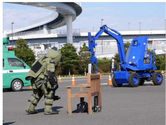
爆発物処理 (東京臨海広域防災公園)