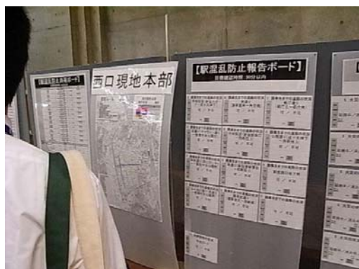
情報共有ボード（平成 22 年新宿駅周辺）

東京都内の既存協議会においては、現地本部又は情報提供ステーションにおいて大型の掲示板（情報共有ボード）を設置し、それを介して情報を受発信する取組を実施している。あわせて、新しいメディア等を活用した情報提供の手段も検討されている。