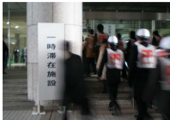
一時滞在施設の開設訓練の様子（平成 24 年度新宿駅周辺）