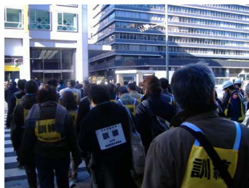
滞留者の誘導訓練の様子（平成20年度新宿駅周辺）