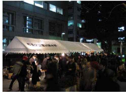
東日本大震災時の徒歩帰宅の様子