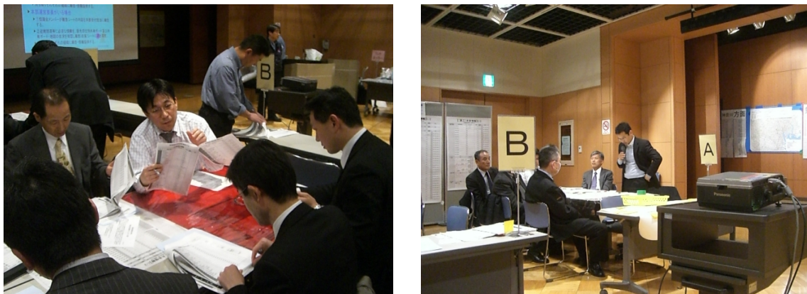
机上（図上）訓練の実施状況（平成 22 年度新宿駅周辺）