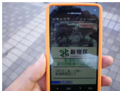
エリアワンセグによる情報発信 （平成 24 年新宿駅周辺）