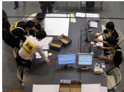
現地本部等の立ち上げ訓練の様子 平成22年新宿駅周辺