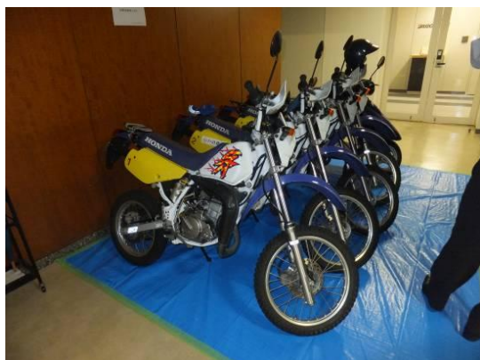
災害時に周辺の道路状況を把握するバイク隊