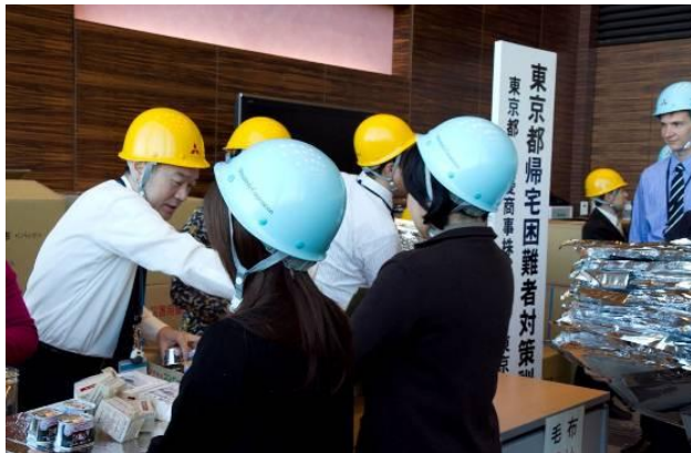
（企業における一斉帰宅の抑制の訓練 東京会場）

平成24年2月3日に実施した「帰宅困難者対策訓練」では、東京駅会場において、自衛消防訓練と連動させた「一斉帰宅抑制訓練」を実施しました。