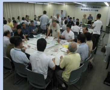
「震災復興まちづくり訓練」 (豊島区雑司が谷・平成25年6月)