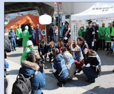
「帰宅困難者対応およびシェイクアウトの訓練」 (千代田区秋葉原・平成26年3月)