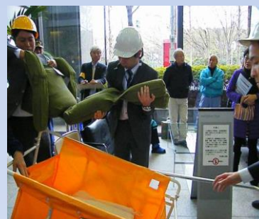
「地域で連携した震災対策訓練」 (新宿区本塩町・平成26年1月)