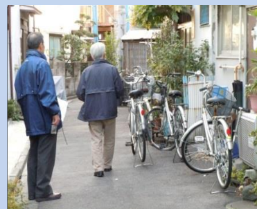
「災害時避難路の検証・路上放置物」 (墨田区立花・平成23年11月)

■問い合わせ シンポジウム実行委員会事務局 (東京都行政書士会) 電話 03-3477-2881