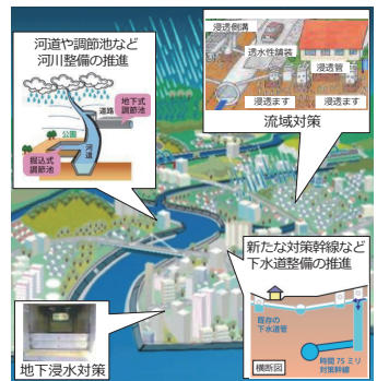
総合的な治水対策イメージ