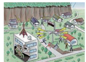
土砂災害警戒区域イメージ