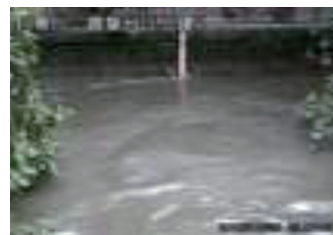
河川監視カメラの映像イメージ