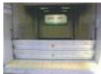
止水板による地下浸水対策事例