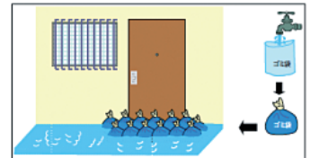
水のうによる簡易水防工法