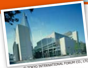
© TOKYO INTERNATIONAL FORUM CO., LTD.