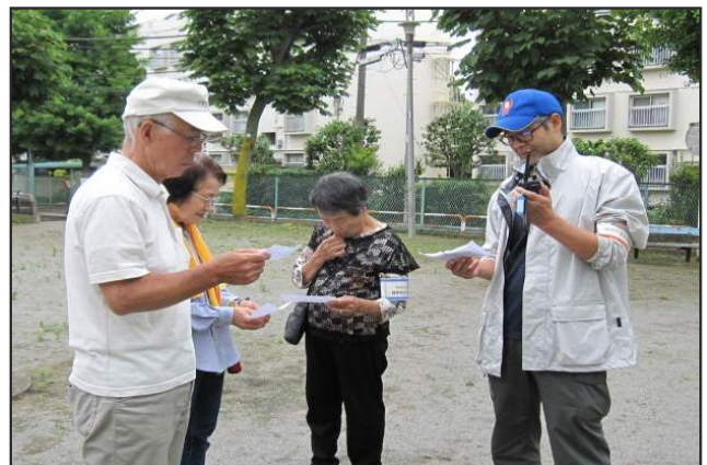
トランシーバー使用訓練