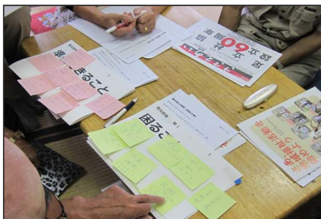
社会福祉協議会とのワークショップ