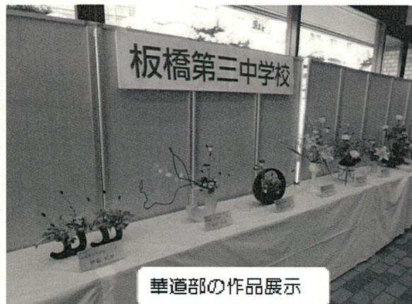
華道部の作品展示