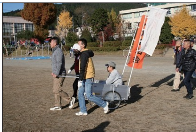
災害時要援護者避難訓練