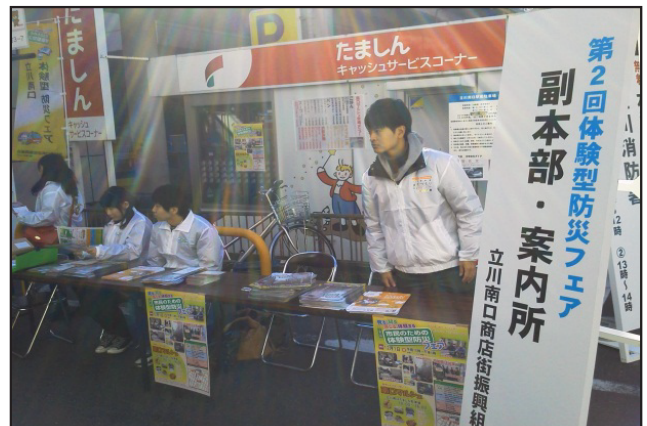
防災フェア案内所