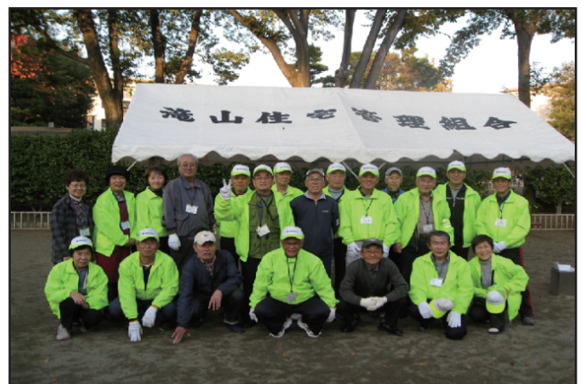
運営委員メンバー