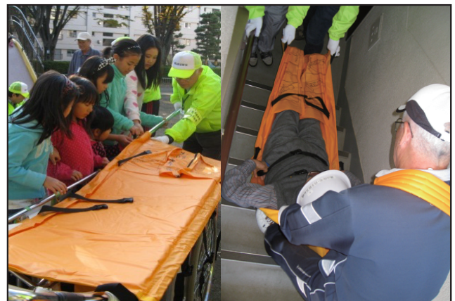
レスキューマット搬出訓練