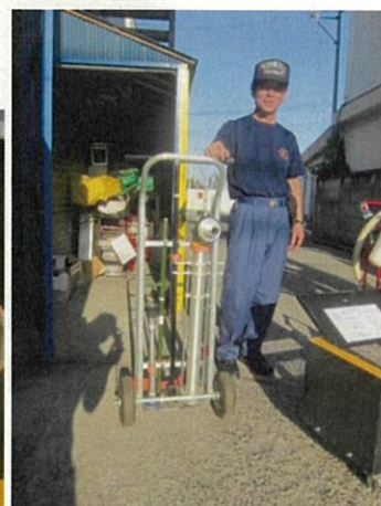
自治会館西側の 26区 さん 宅前の消火栓