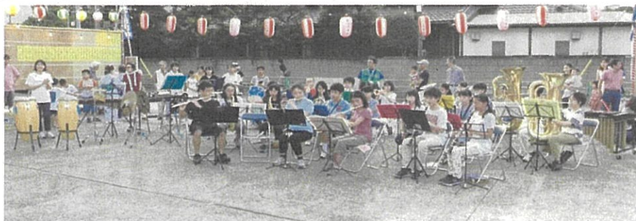
和田中学校 吹奏楽