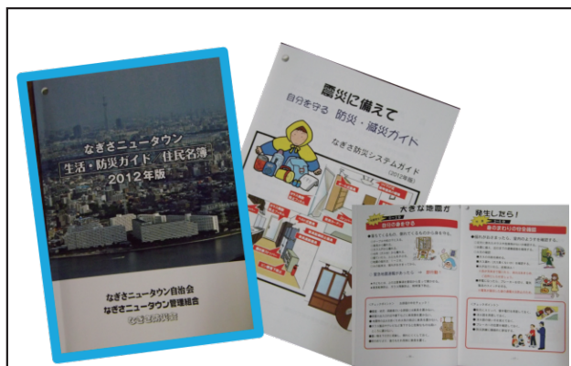
防災ガイドと一体の住民名簿