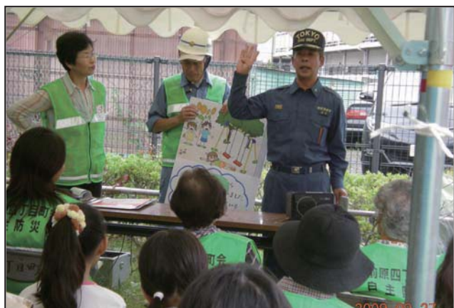
消防署からの講習