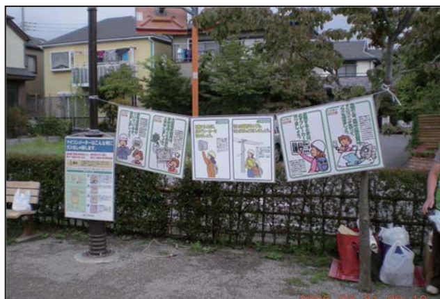
電器・ガスの取扱いの広報活動