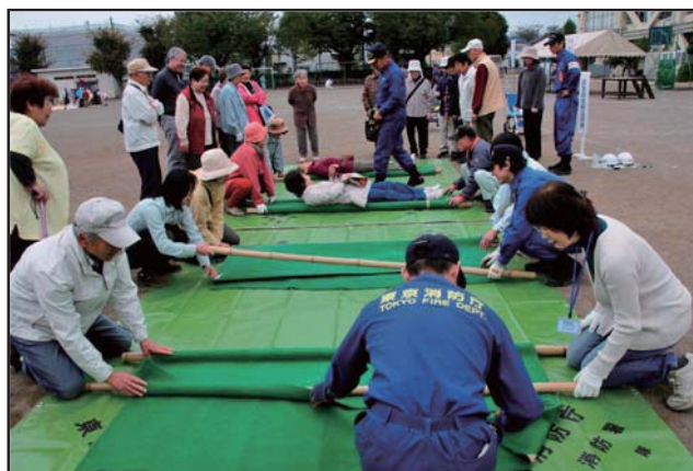
簡易担架作成訓練