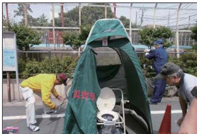
マンホールトイレ設置訓練