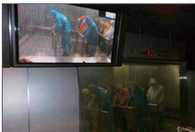
体験学習（風速30m/sの体験）