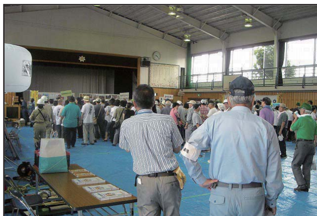
10町会合同防災訓練（体育館に一時避難）