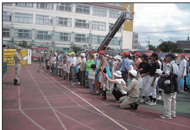
10町会合同防災訓練（訓練内容の訓示）