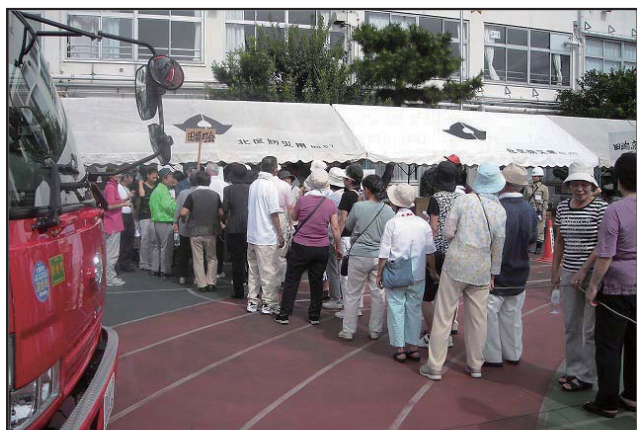
10町会合同防災訓練（町会ごとに整列）