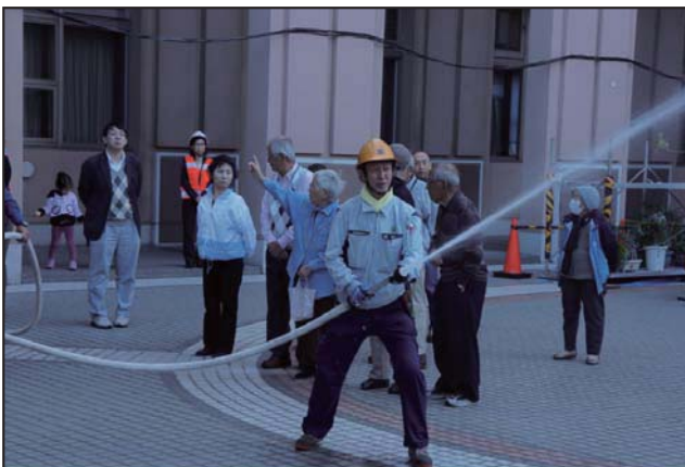
屋内消火栓操作訓練