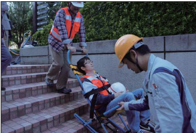
階段避難車操作訓練