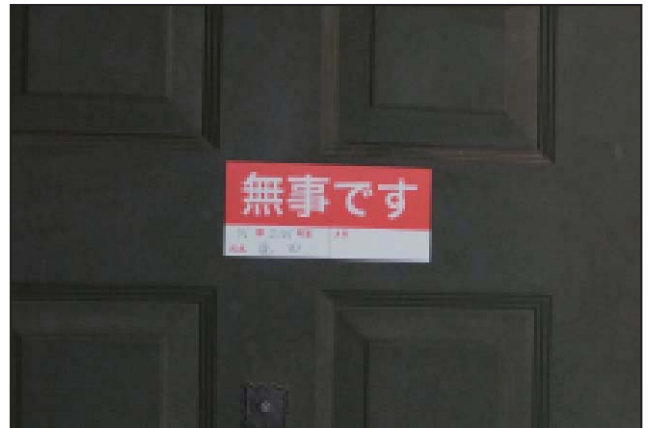
玄関扉に貼った「無事ですシート」