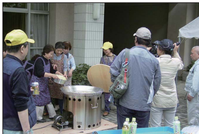
合同防災訓練（炊き出し訓練）