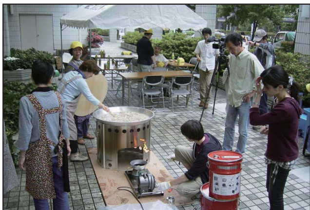
合同防災訓練（炊き出し訓練）