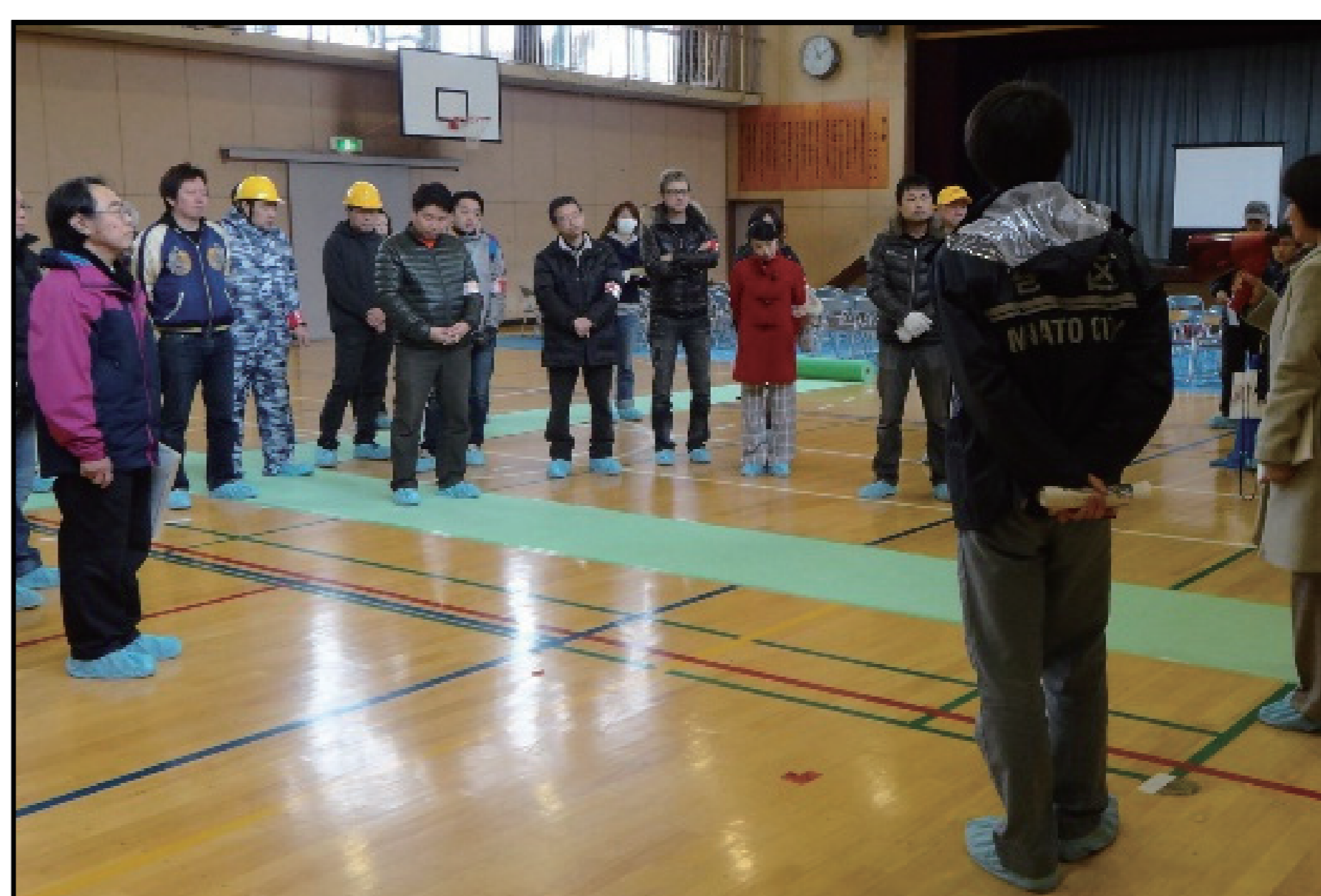
避難所運営訓練（避難者受入）