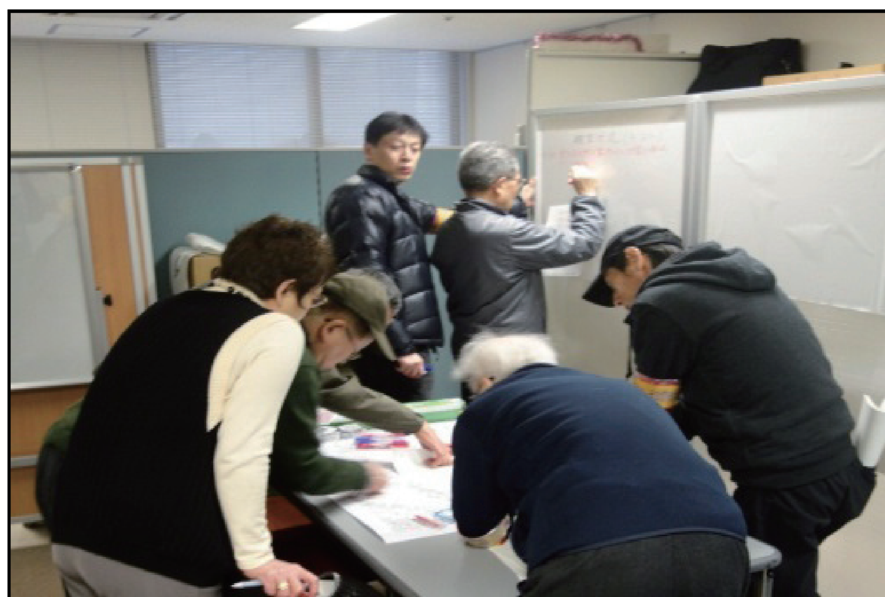
避難所運営訓練（情報集約）