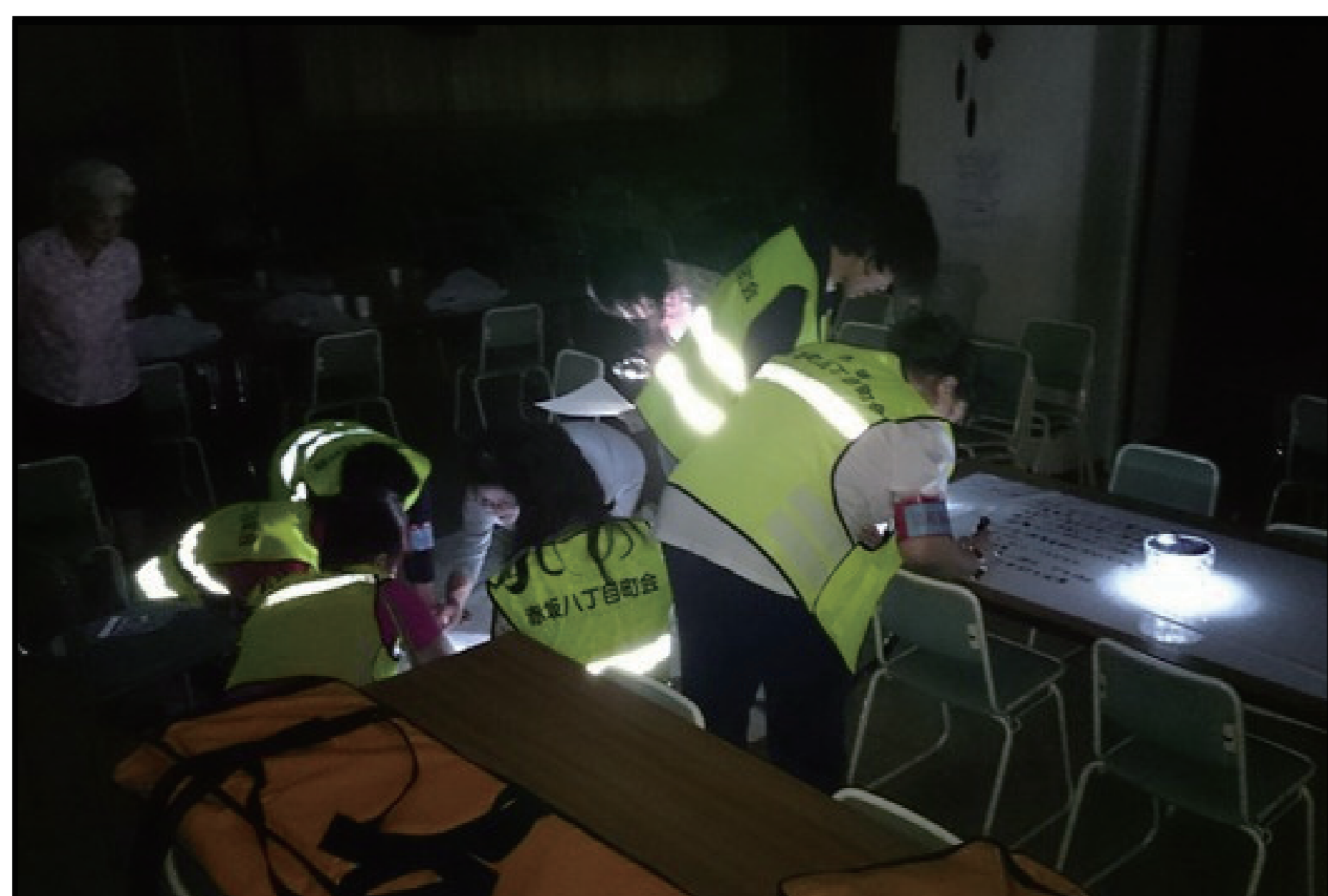
夜間における避難所立ち上げ訓練