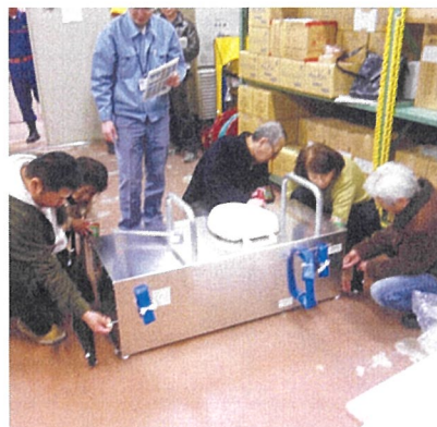
【全員で協力したおかげで、比較的短時間で完成させることができました】