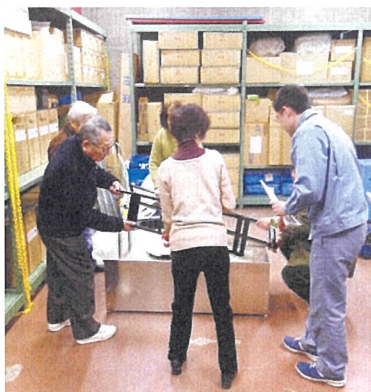
【簡易トイレの手順を確認しながら、つくります】