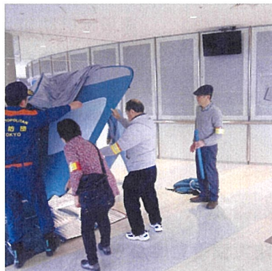
【多目的ハウスを全員で組み立てます】