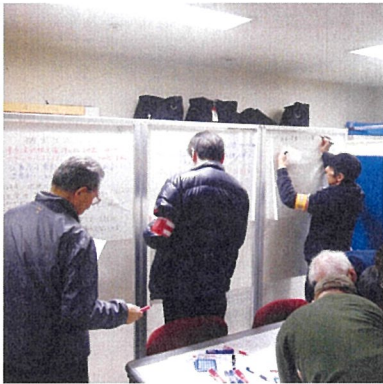
【被害状況をまとめます】

○赤坂区民センターブロックの防災マップを用意し、避難所周辺地域の被害状況報告をもとに、防災マップに情報を集約し、被害状況をまとめます。