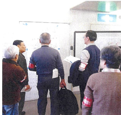
【避難所に必要な情報を掲示します】