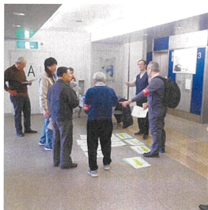
【避難スペースに貼紙を貼るにあたり、何をどこに貼ればいいのかを話し合います】