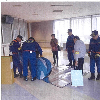
【多目的ハウス、ダンボールパテーションそれぞれの設置にかかります】

○赤坂区民センター各部屋を町会・自治会ごとに分けをします。 ○多目的ハウス、ダンボールパテーションの設置をします。