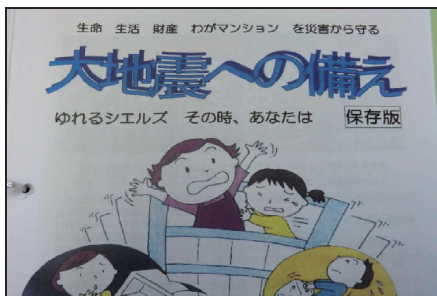
災害時マニュアル