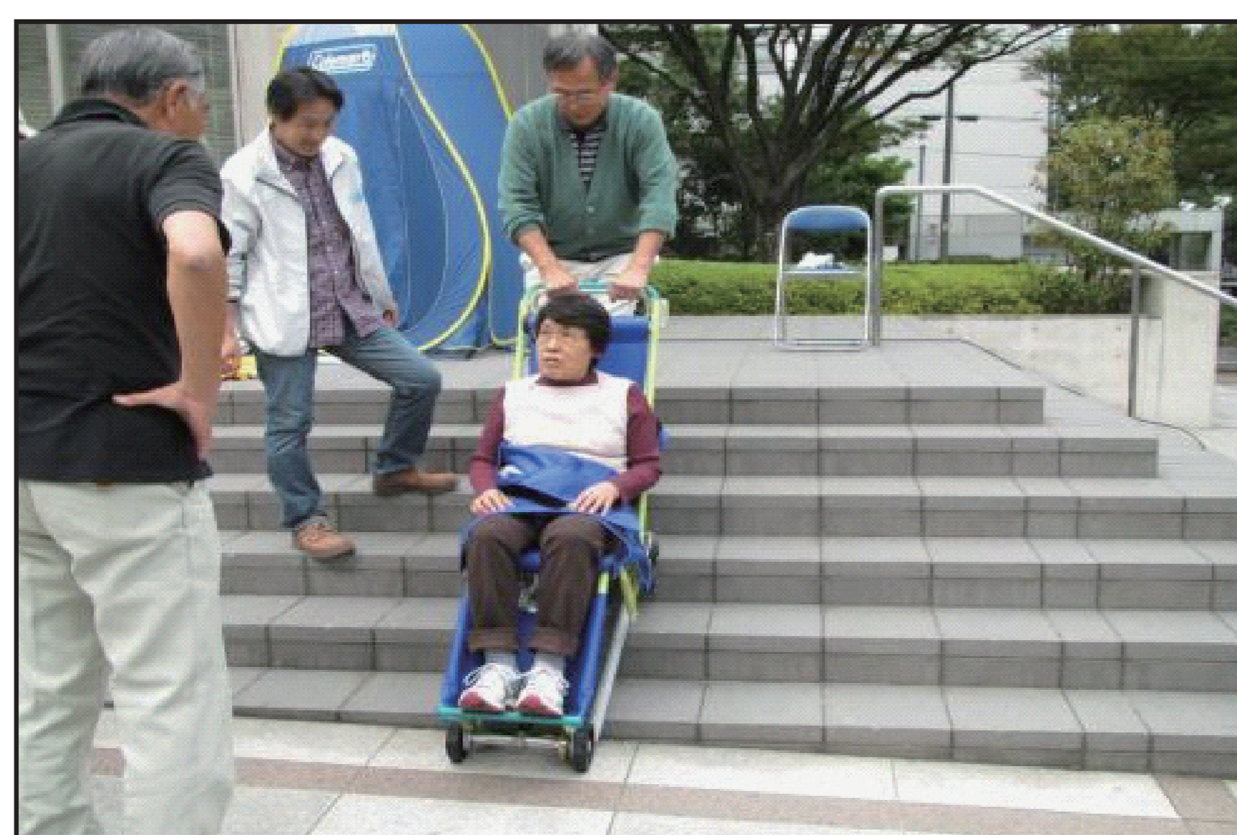
要配慮者避難訓練