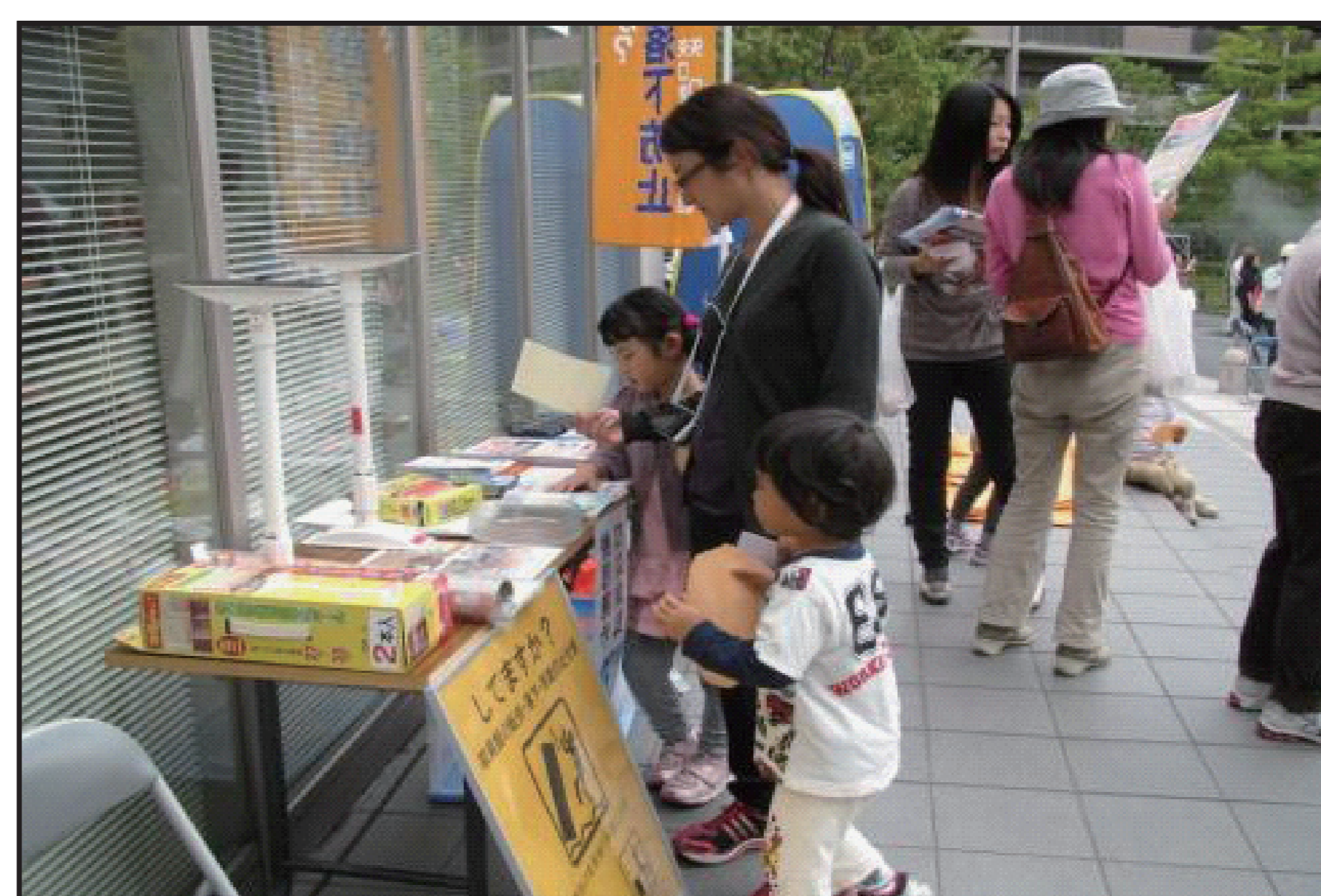
家具転倒防止広報