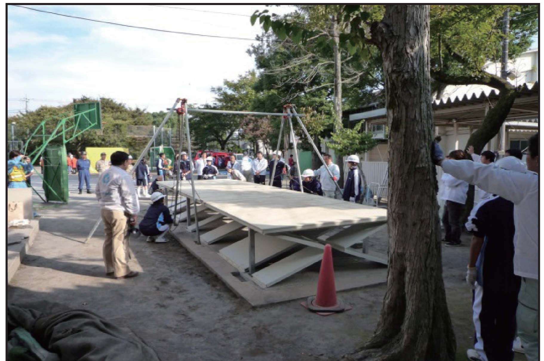
仮設トイレ組立訓練