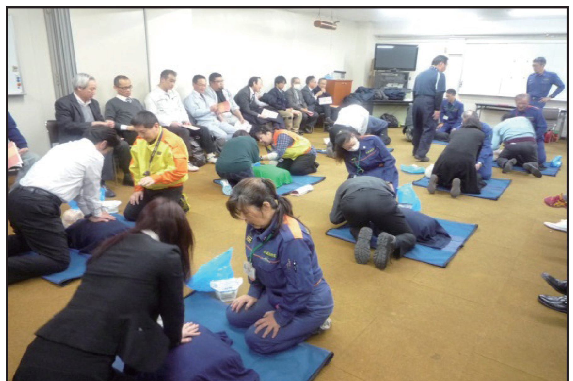
普通救急救命講習会