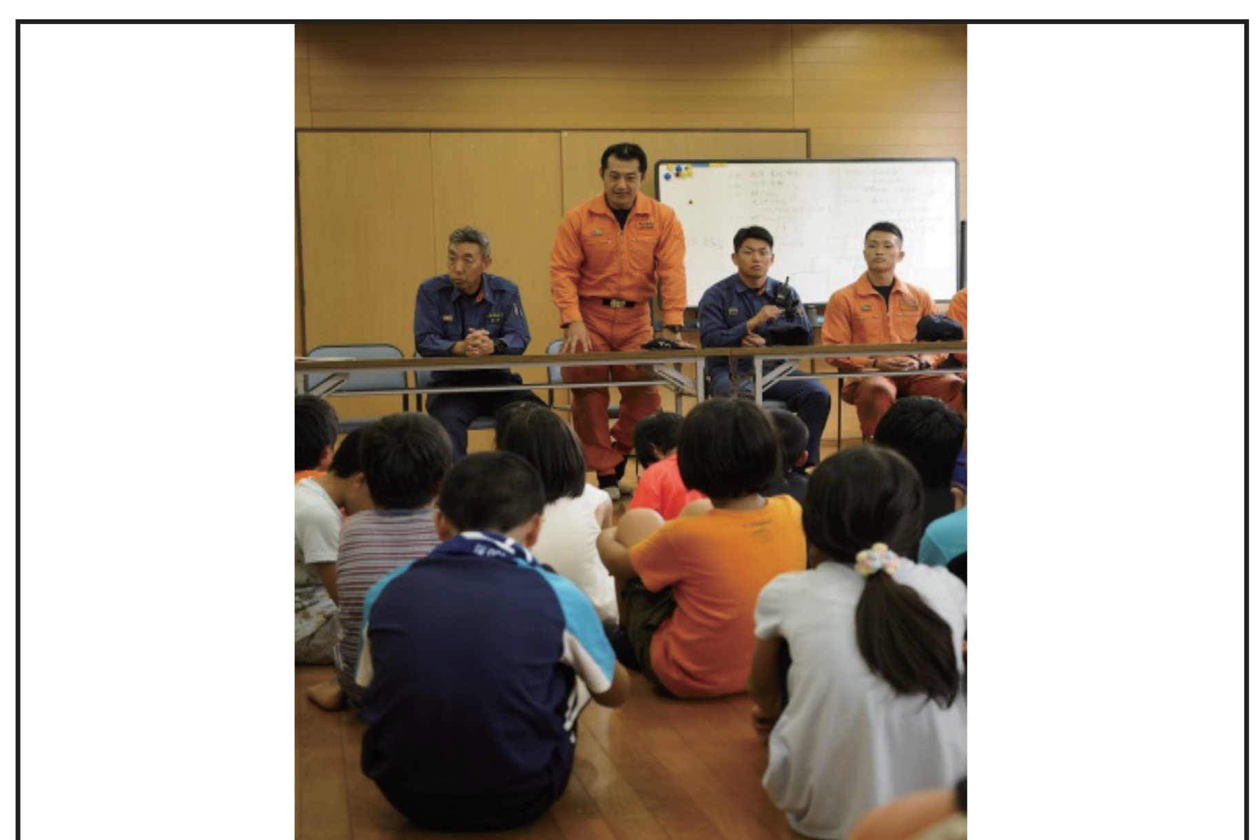
小学生対象ミニキャンプ