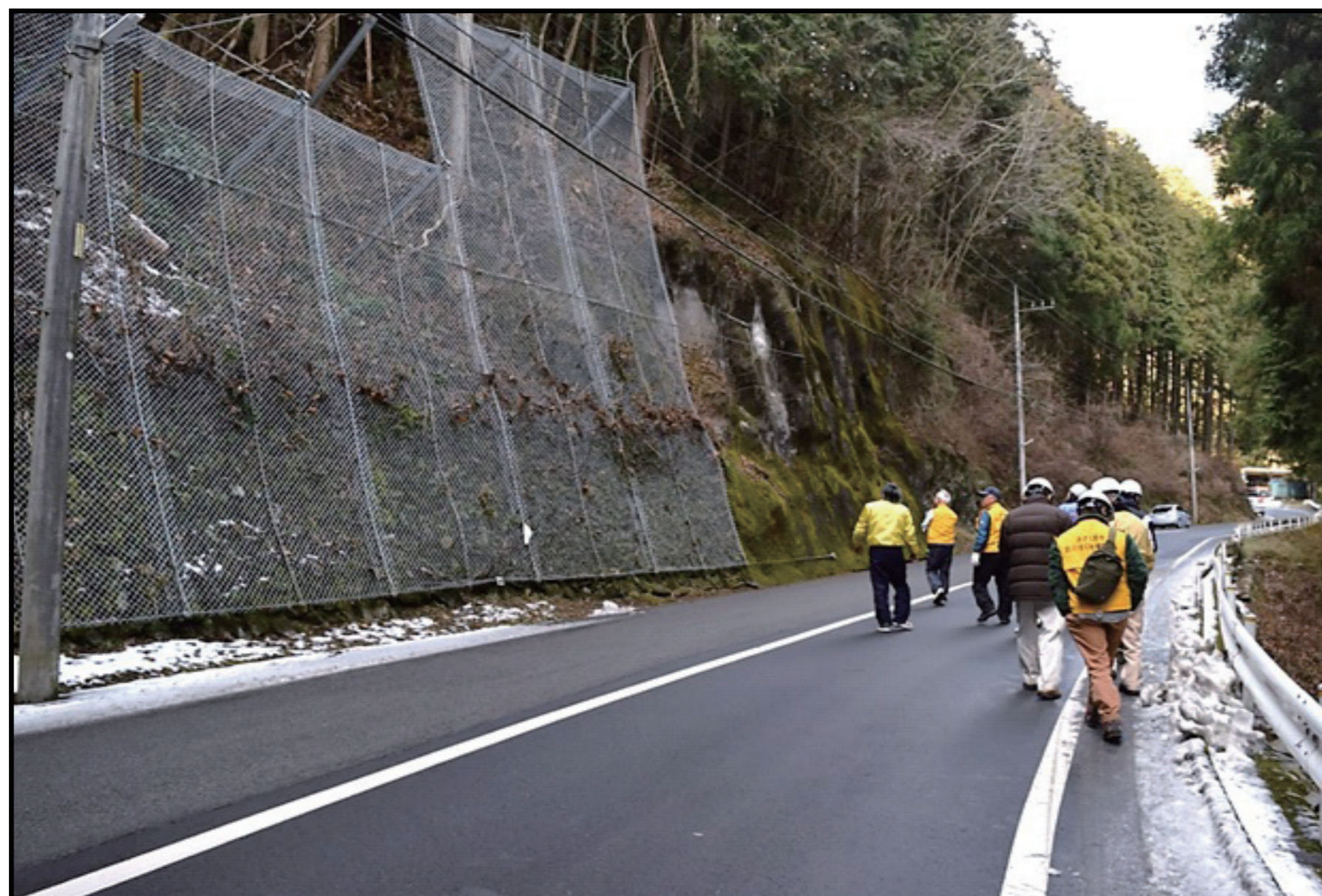
危険箇所の实地踏査