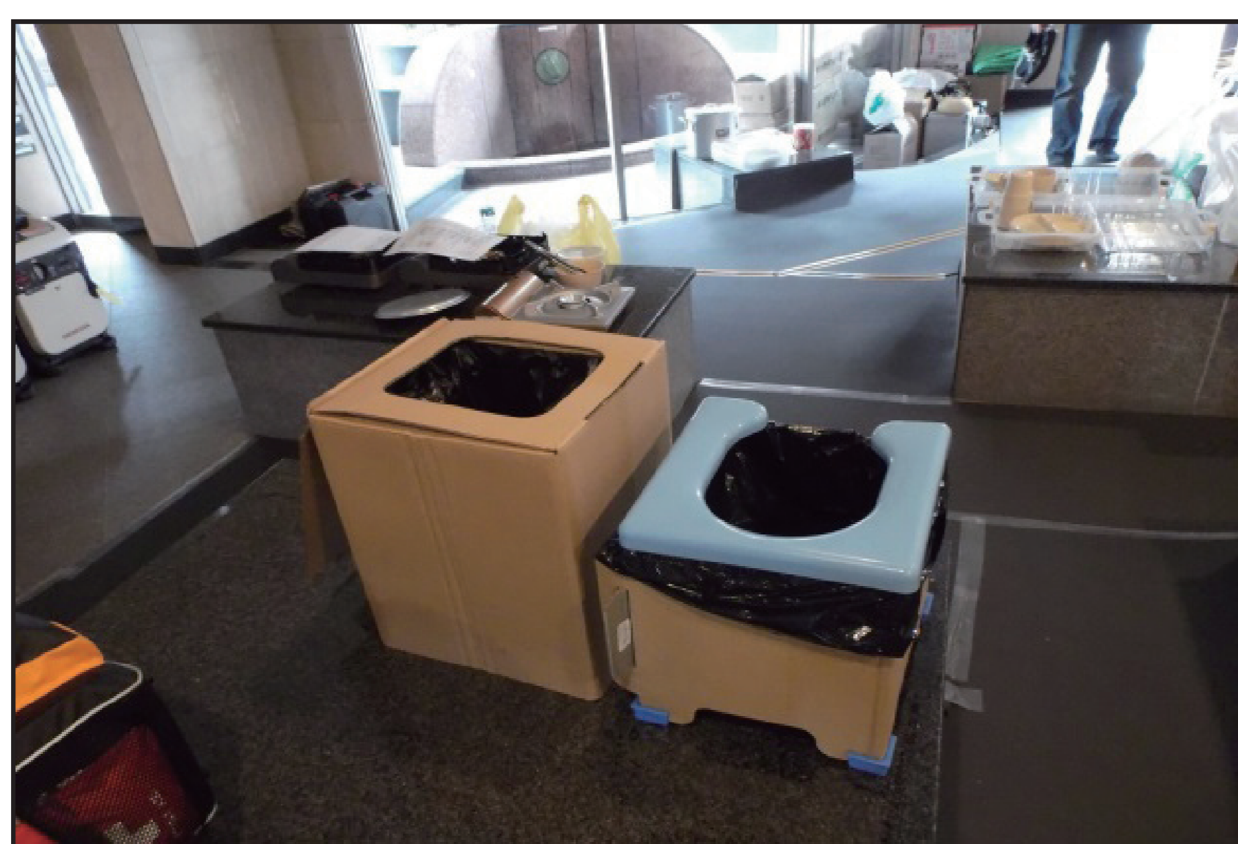
ポータブルトイレ使用訓練