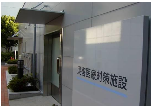
災害医療対策施設

ICU(4床)、生体情報モニタリングシステム、心電図監視装置、CT装置、MRI(磁気共鳴断層撮影装置)、血管連続撮影装置、シンチレーションカメラ、CR装置、X線テレビジョン装置、生化学自動分析装置、人工心肺装置、超音波診断装置 等