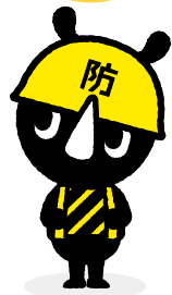
東京防災公式キャラクター 「防サイくん」