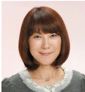
株式会社危機管理教育研究所 代表