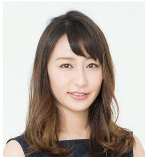
フリーアナウンサー