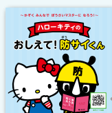
とうきょうぼうさいえほん