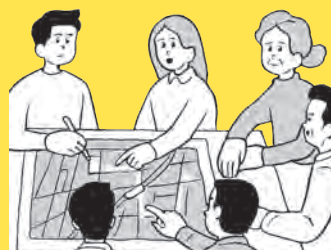
□ 避難先を確認しよう ➔ 115 ページ