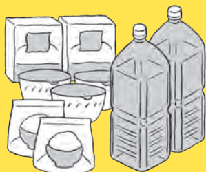
□ 日常備蓄を始めよう ➔ 085 ページ