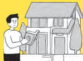
□ 耐震化チェックをしよう ➔ 107 ページ