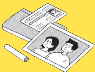
□ 大切な物をまとめておこう ➔ 091 ページ