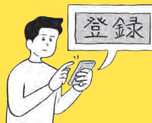
□ 災害情報サービスに登録しよう ➔ 128 ページ