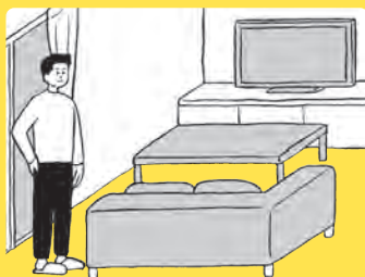
□ 部屋の安全を確認しよう ➔ 095 ページ