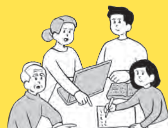
□ 家族会議を開こう ➔ 122 ページ