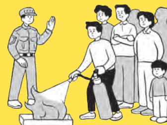
□ 防火防災訓練に参加しよう ➔ 130 ページ