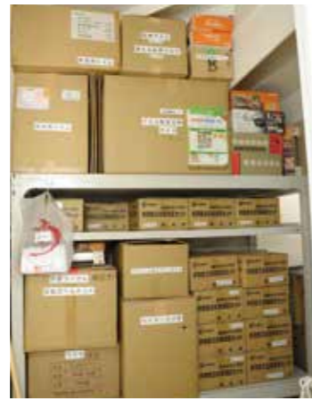
丈夫な階段下や別の倉庫に積まれた備蓄品

仙台にも支店を持つ積水工業は、東日本大震災時には多くの災害復旧の業務を行った。その経験から、地域にインフラを普及させることが、給排水衛生設備業である当社の使命であると強く感じている。 そのため、災害時に社員の安全を確保しながら、いち早く業務を開始することを目的として、72時間分の備蓄をはじめ定期的な防災訓練、社員への周知・啓発活動などに力を入れている。 備蓄品は一か所に置かず、一斉に失うことを避けるため、数か所に分散保管している。