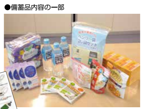
簡易トイレの使用方法も図で解説

初動対応後に社内滞在を決定した段階から自衛消防隊をフロア自治隊に転換し、帰宅抑制期間中の自治活動を統率する。2012年にマニュアルを作成し、自治隊長の下に、情報連絡、衛生環境、資源管理、救護の4つの班を設置。各班だけでは人数が足りないため、各フロアで委員を選出して備蓄品配布だけでなく外部情報共有や廃棄物管理も行う設計。