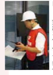
自衛消防隊長からCMTへMCA無線を使用して報告