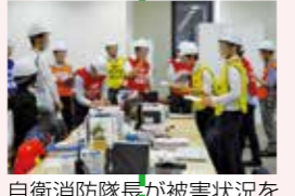
自衛消防隊長が被害状況を集約