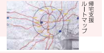
帰宅支援ルートマップ

チキンラーメン／カップヌードルの保存缶を備蓄(3年間保存可能) 火を使わずに温かい即席麺を食べるための備蓄品も用意。