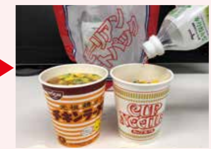
加熱したお湯を即席麺に注ぐ