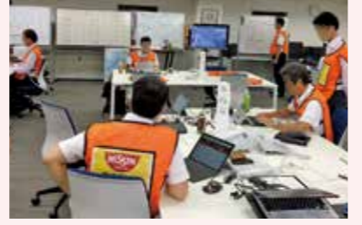
CMTの活動(2018年9月北海道胆振東部地震)

災害対策本部の下部組織CMTが、社内の被害状況や社外のライフライン状況等、様々な情報収集にあたる。