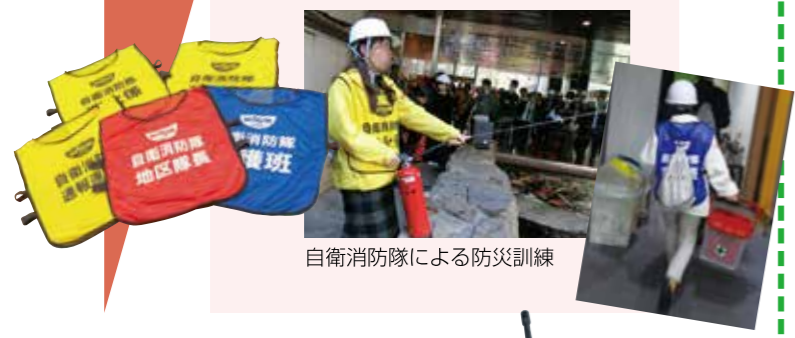
自衛消防隊による防災訓練