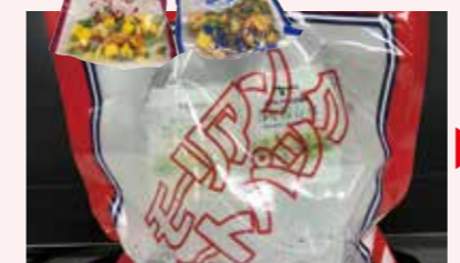
発熱材が入っている袋に水を入れるだけでペットボトルの水を加熱することができる備蓄品

チキンラーメン／カップヌードルの保存缶を備蓄(3年間保存可能) 火を使わずに温かい即席麺を食べるための備蓄品も用意。