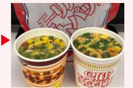
3分後、火を使わずに出来上がり