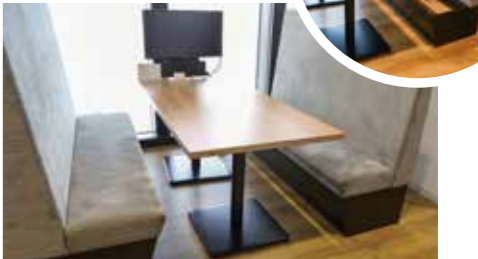
打ち合わせ用のベンチを持ち上げると備蓄品が