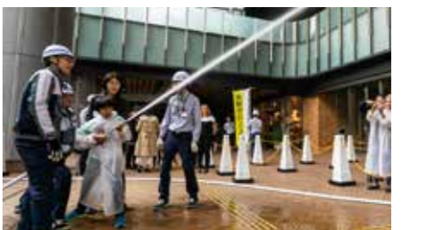
屋内消火栓放水訓練