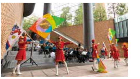
東京消防庁音楽隊による演奏