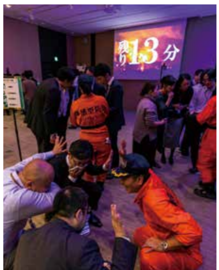
訓練に真剣に取り組む参加者たち

た英語による防災訓練にも取り組んでいる。このような防災訓練を通じて、当社の取り組みを広く地域にアピールして、地域全体の防災力向上に努めている。