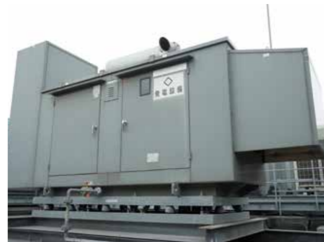
屋上の自家発電設備。停電時、自動稼働する