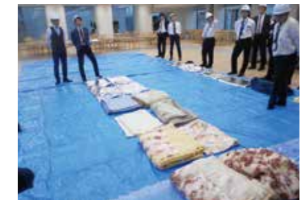
帰宅困難者向け施設開設訓練