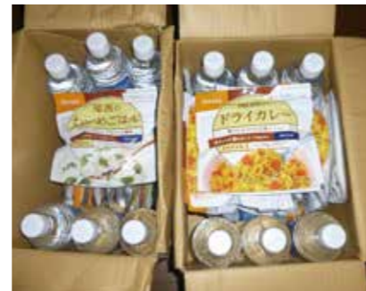
社員自宅に配付している一週間分の水・食料。家族の人数分用意し、自宅が被災した場合への備えとしている