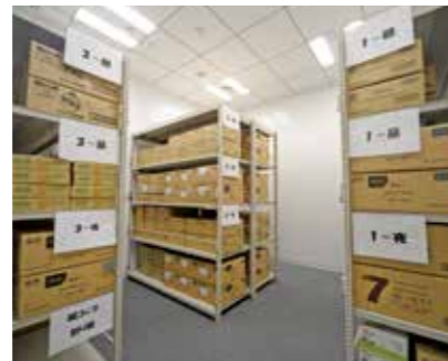
非常食を備えた倉庫。日別に朝、昼、夜の張り紙をし、万が一担当者がいない場合にも食事を提供できるようにしている

東京本社では大地震発災時、帰宅困難となる期間を1週間と想定して、社員400人分(東京本社ビル平均在席者数分)の水や食料、非常用トイレ、寝具、日用品など1週間分を備蓄している。3階と7階の倉庫に分散して保管し、自社のデータベースで消費期限などを管理。さらに社員とその家族を守ることを最優先とする考えから、家族分の水や食料1週間分を社員自宅にも配付している。