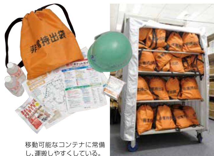
移動可能なコンテナに常備し、運搬しやすくしている。

ビル備え付けの非常用電源の他に、自社で自家発電設備を増設しており、災害時の帰宅困難者向け施設およびBCPに対応できるようにしている。自家発電稼働は約80時間で、3階と7階の空調、照明、一部コンセントの電力として使用できる。