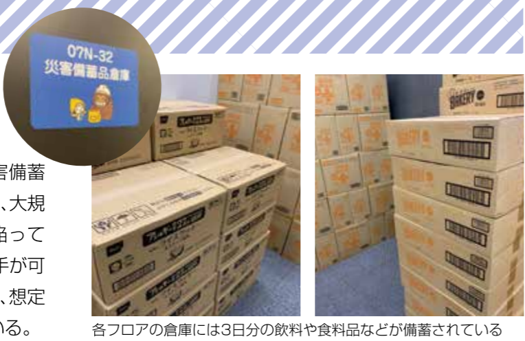
各フロアの倉庫には3日分の飲料や食料品などが備蓄されている

防火区画を考慮し、各フロアに2箇所ずつ災害備蓄倉庫を設置している。このように配置することで、大規模災害発生時に階段が使えないような事態に陥っても、他のフロアに移動することなく、備蓄品の入手が可能となる。また、各倉庫には飲料や食料品などが、想定出社人数プラスαも考慮して3日分備蓄されている。