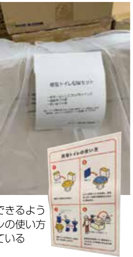
誰でも使用できるように簡易トイレの使い方は図案化している

簡易トイレは、使い方を図案化したポスターを用意。また、実際の利用を想定して、トイレを回収する箱や袋、手袋等も備蓄している。