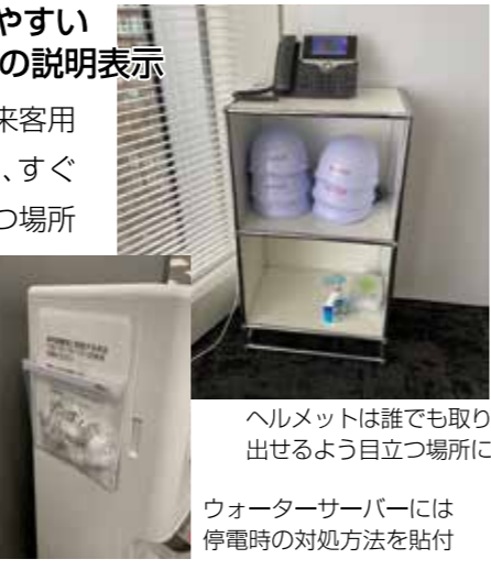
ヘルメットは誰でも取り出せるよう目立つ場所に

来客会議室の室内に来客用のヘルメットを配備し、すぐに取り出せるよう目立つ場所に配置。またウォーターサーバーには、停電時の注水方法をマニュアルにしてまとめ、サーバー自体に貼り付けてある。