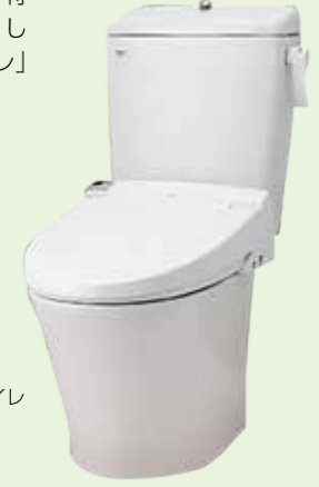
レジリエンストイレ

LIXILはトイレメーカーとして、災害時のトイレ問題の解決に向けて取り組んでおり、2019年4月、災害時の避難所においても水洗利用できる、快適で使いやすいINAX災害配慮トイレ「レジリエンストイレ」を発表。平常時は5L、災害時は1Lの水で洗浄可能な状態に切り替えることで、災害での断水時でも、いつものトイレをそのまま快適に使用できるのが特徴。本店の防災対策として「レジリエンストイレ」を配置した。