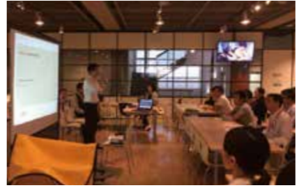
定期的に防災訓練および研修会を実施