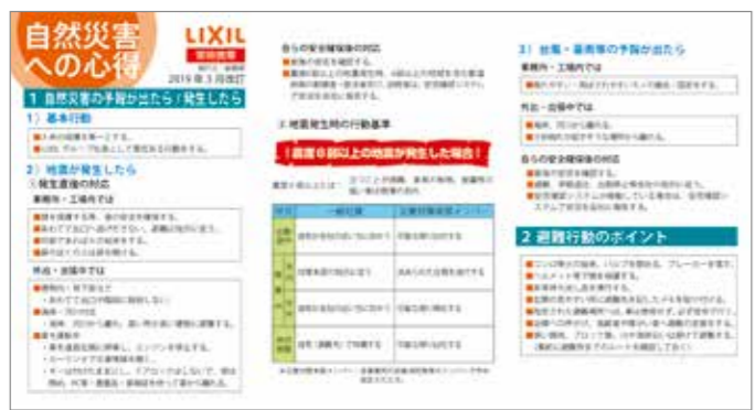
自然災害への心得201903改訂

事業所待機が必要となった際の対応について、現地対策メンバー全体でワークショップを行い具体的な行動マニュアル・フローを作成。本社ビルではこれを基に負傷者対応、従業員・外来対応、備蓄品配布、館内情報連絡などを分担して行うことで、スムーズに対応することを可能にした。