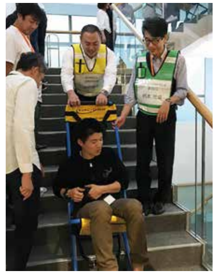
階段での負傷者搬送の訓練の様子