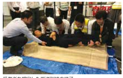
受傷者を想定した搬送訓練の様子

本社ビルでは訓練や研修を通して防災計画の実効性を検証し、対策メンバーへの浸透を行っている。館内チラシや社内サイネージ、社内SNSを通じて、一般の従業員への周知も実施。