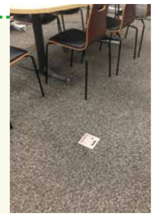
●非常自家発電コンセントA

非常用専用のコンセントは、通常用と兼用のコンセントも入れれば11階は27ヶ所×2で54、12階は36ヶ所×2で72。合計126か所のコンセントを利用することができる。