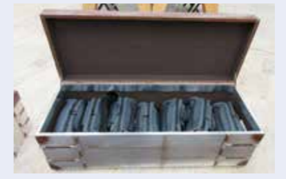
非常時はすぐに持ち出し袋を取り出せる