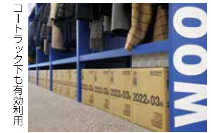
コートラック下も有効利用