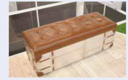
平時は来場者が座るベンチとして利用