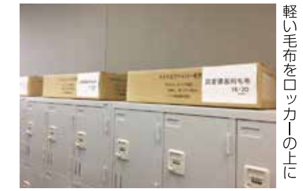
軽い毛布をロッカーの上