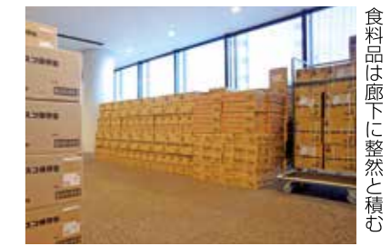
食料品は廊下に整然と積み