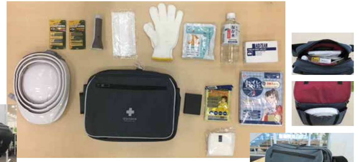
●非常用持ち出し袋の中身 保存食・保存水、ヘルメット、簡易トイレ、レスキューシート、軍手、救急セット、マスク、モバイルバッテリー、乾電池、ライト、生理用ナプキンなど計12種類

誰がいつ入社してどこに座っていても避難袋を持って逃げ出せるように椅子の背もたれに設置、また持ち出しやすいコンパクト性を重視した避難袋となっている。