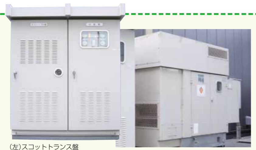
(左)スコットトランス盤 (右)自動切換盤 自家発電装置

非常用専用のコンセントは、通常用と兼用のコンセントも入れれば11階は27ヶ所×2で54、12階は36ヶ所×2で72。合計126か所のコンセントを利用することができる。