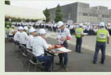
地区隊員から本部へ安否、怪我人等を報告