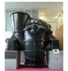
創業初期(大正)の東京・浅草田町ポンプ場向け大型ポンプ(本社展示)

業 種／製造業 主な事業内容／風水力事業、環境プラント事業、精密・電子事業 従業員数／単体4,047人、連結17,480人(2020年12月末現在)