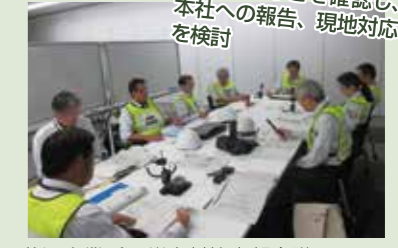
藤沢事業所の災害対策本部会議