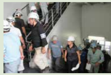
津波を想定し、屋上へ避難する訓練