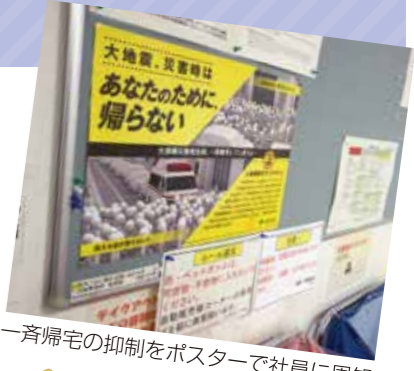
一斉帰宅の抑制をポスターで社員に周知

備蓄品はデータから算出した常時建物内にいる人数分のほか、大田区との協定に基づく津波時の受入人数分を確保している。備蓄リストは全社を一覧にして確認できるようにしている。