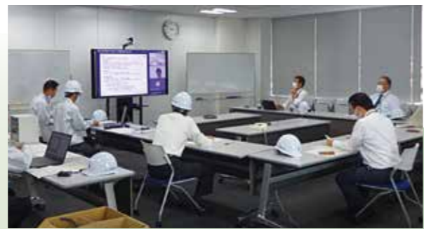
執行役を対象にした訓練。一部役員はリモートでの参加

全社員は年3回、一斉に安否確認システムへの対応訓練を行い、使い方の習熟、登録不備の解消に努めている。