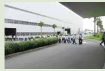
屋上へ避難した後、状況を把握し屋外へ