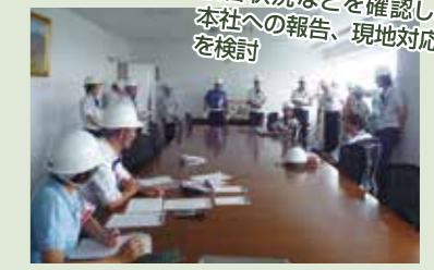
富津事業所内本部での対策会議の様子