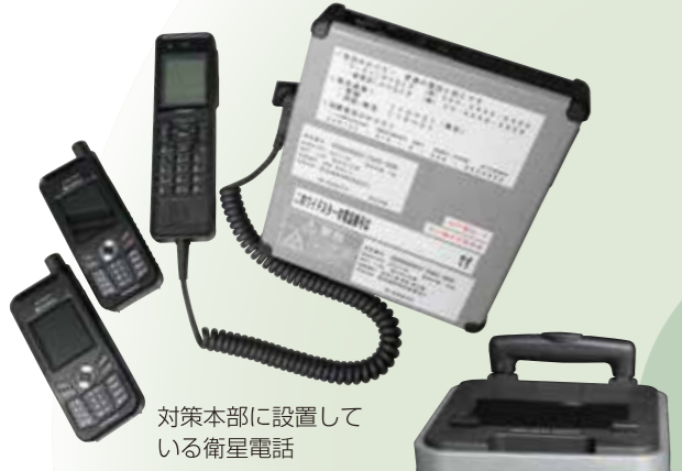
対策本部に設置している衛星電話