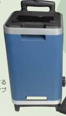
停電に対応するためのポータブル蓄電池