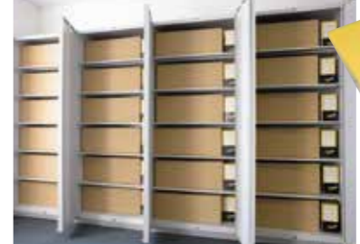
各階ごとにまとめられた備蓄品