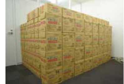
一か所にあった備蓄品を各フロアに分散