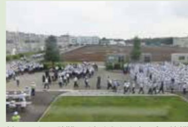
地区ごとに避難し、決められた場所で待機