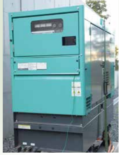
社屋裏のディーゼル発電機も操作手順を常に訓練