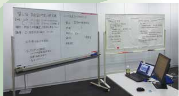
全員が参集せず、電話で会議を行うリモート訓練も実施している