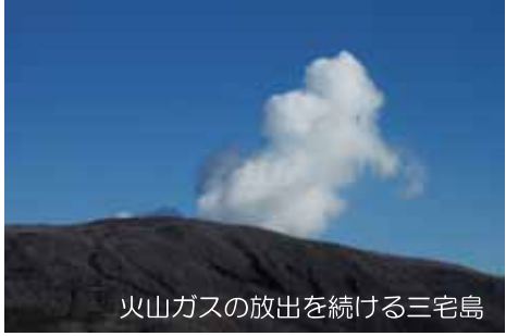
火山ガスの放出を続ける三宅島

この三宅島観光セーフティガイドマップは、観光客の皆様にも三宅島を安全にお楽しみいただくため、島内で守っていただきたいこと、知っていただきたいことをまとめたものです。