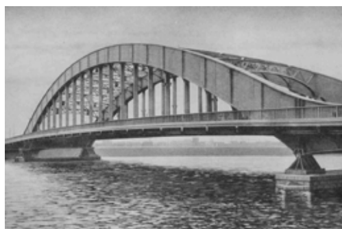
震災復興橋梁 - 永代橋 1926年竣工(東京都立中央図書館蔵)

今年は、1923年(大正12年)9月1日に関東大震災が発生してから、100年を迎える年です。 東京都は、都民の皆様と一緒に防災について考え、「100年先も安心」を目指して取組を推進していきます。