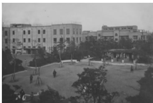
震災復興小公園 - 元加賀小学校と元加賀公園 1927年竣工(東京都復興記念館蔵)