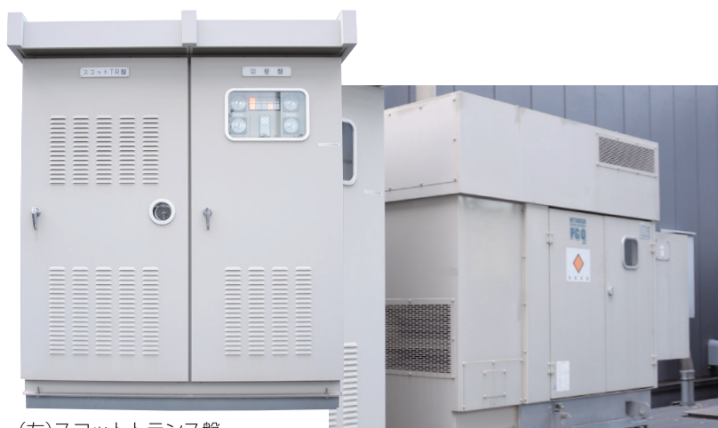
(左)スコットトランス盤 (右)自動切換盤