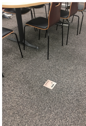
●非常自家発電 コンセントA

非常用専用のコンセントは、通常用と兼用のコンセントも入れれば11階は27ヶ所×2で54、12階は36ヶ所×2で72。合計126か所のコンセントを利用することができる。