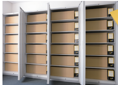
各階ごとにまとめられた備蓄品