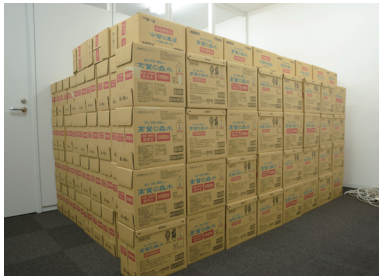
一か所にあった備蓄品を各フロアに分散